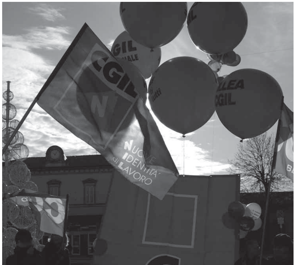
Manifestazione e presidio a Bergamo, 12 dicembre 2009