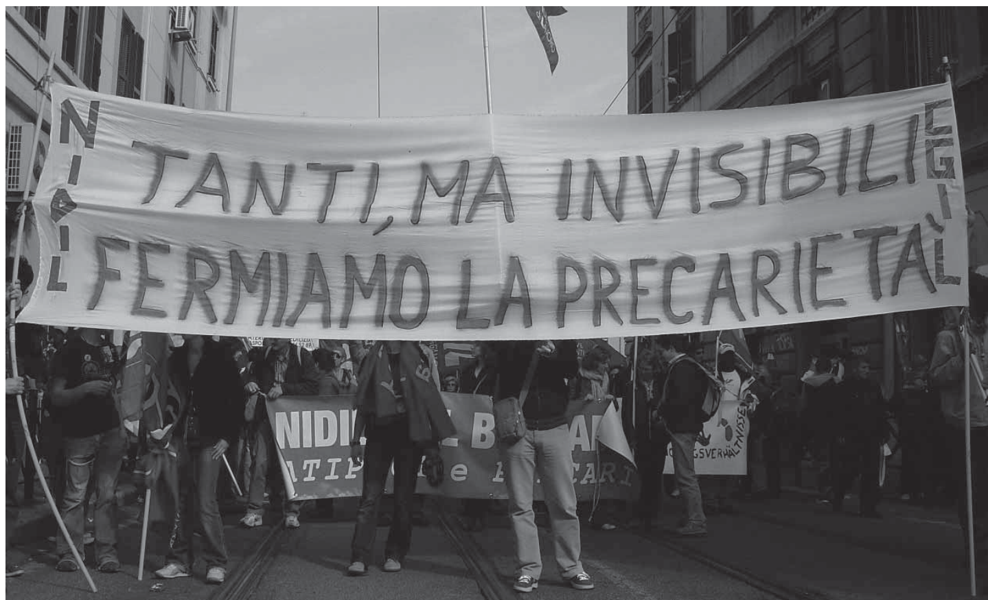
Sciopero e manifestazione CGIL a Roma, 4 aprile 2009

Colpisce, infine, l'esiguità della contribuzione Inps (13%, addirittura più bassa della contribuzione alla gestione separata Inps per i collaboratori a progetto). Con una contribuzione talmente bassa anche laddove il lavoro accessorio potrebbe avere senso è comunque discutibile parlare di reale emersione.