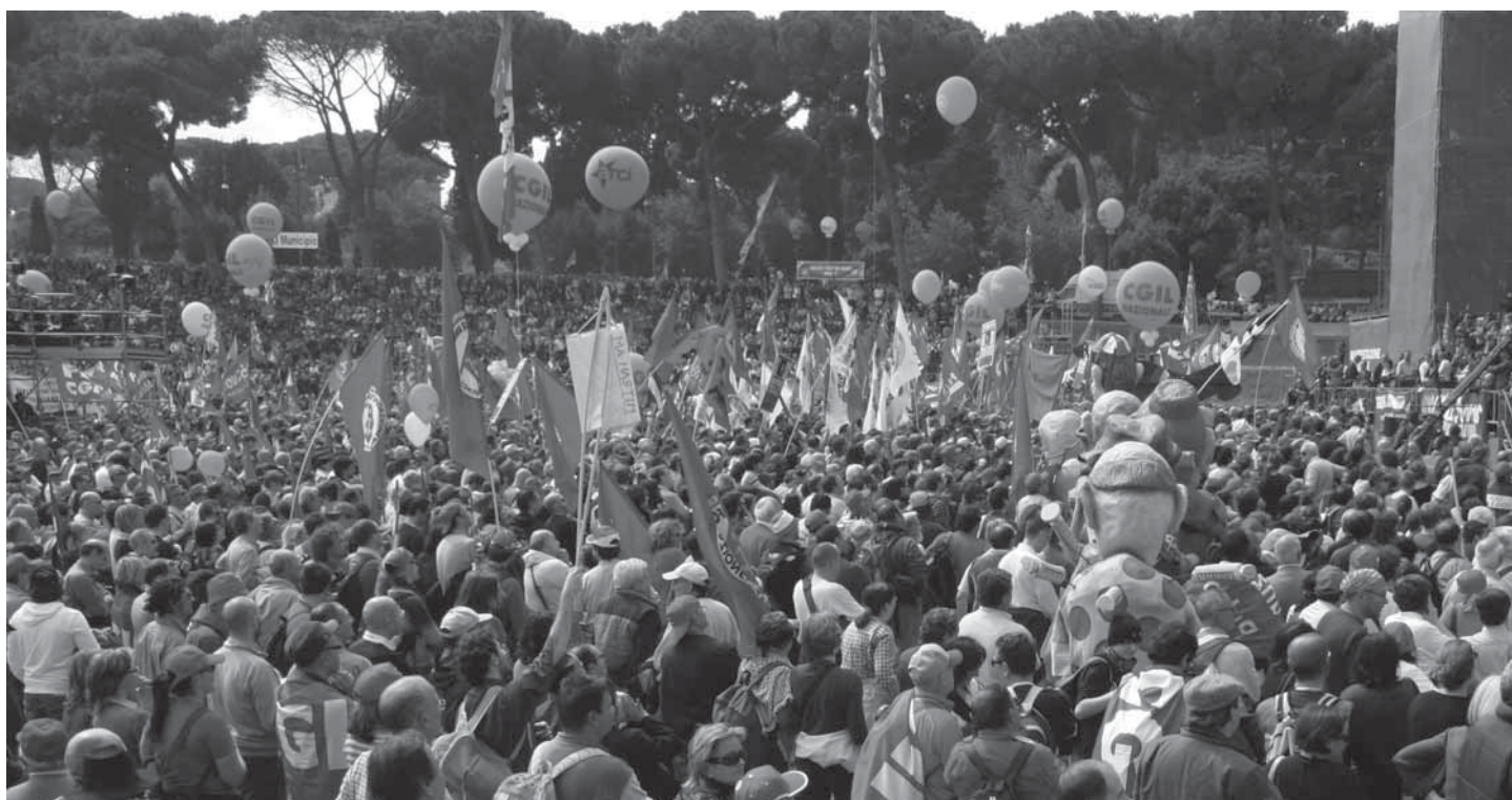
Sciopero e manifestazione CGIL a Roma, 4 aprile 2009

Vediamo ora quali sono gli ammortizzatori sociali esistenti per i lavoratori atipici.