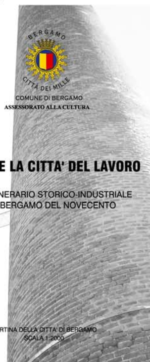
CARTINA DELLA CITTA' DI BERGAMO SCALA 1:2000

Troppo poco si è conservato per parlare di un museo all'aperto; questa cartina è piuttosto una ipotesi sia di lavoro sul territorio che di itinerari nella Bergamo della rivoluzione industriale, per tutti coloro che provano interesse per le vicende del lavoro dell'uomo. L'Amministrazione comunale di Bergamo ha fortemente voluto realizzare questa ricerca, con l'auspicio che essa possa essere uno strumento importante per consentirci di "leggere" la nostra città e la sua storia e per promuovere la conoscenza e la difesa della memoria del lavoro e dei lavoratori. La speranza è che possa essere anche il punto di partenza per nuovi contributi ed esiti di studio.